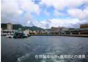
佐世保市役所・港湾部との連携